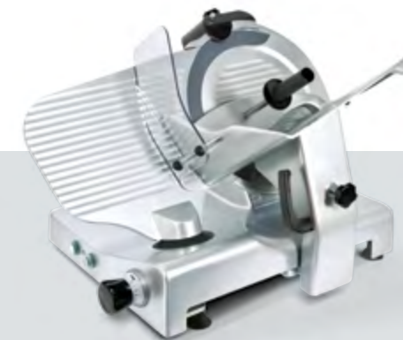
VERSIONE NERA BLACK VERSION